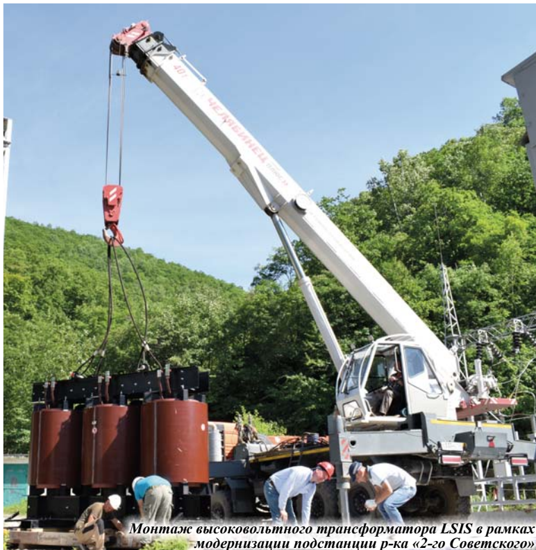
Монтаж высоковольтного трансформатора LSIS в рамках модернизации подстанции р-ка «2-го Советского»