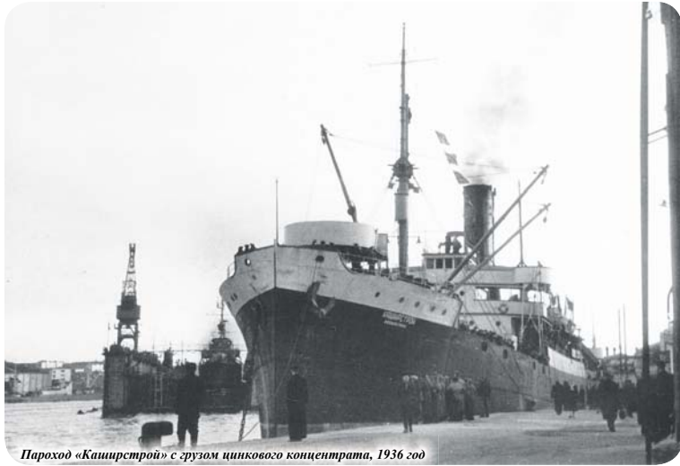
Пароход «Каширстрой» с грузом цинкового концентрата, 1936 год

Вникая в общественно-политическую повестку 1930-х годов, всё чаще проводишь параллели с сегодняшней реальностью. Ситуация очень похожа. Ощущение, что