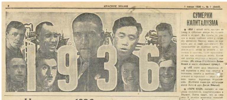
Фрагмент газеты «Красное Знамя» от 1 января 1936 г.