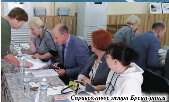
Справедливое жюри Брейн-ринга