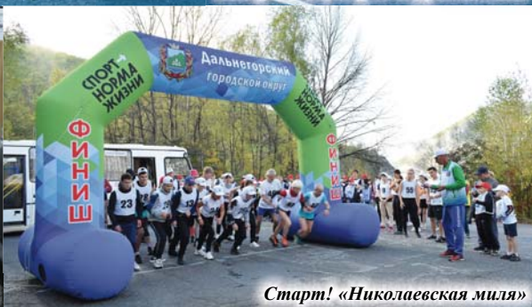
Старт! «Николаевская миля»