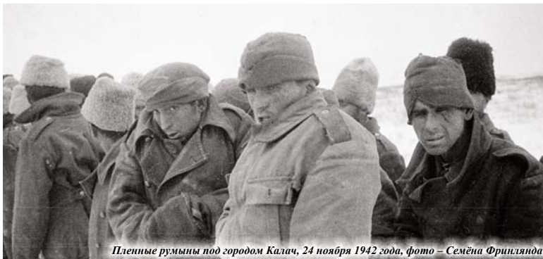
Пленные румыны под городом Калач, 24 ноября 1942 года

Фильм «Сталинградская битва» смотрится на одном дыхании, поскольку картина действительно получилась исторически выверенной и реалистичной. Художественные и документальные кадры сочетаются в этом фильме очень гармонично. А некоторые сцены, например, падение бомбардировщика на дом или переправа через Волгу, сняты просто великолепно!