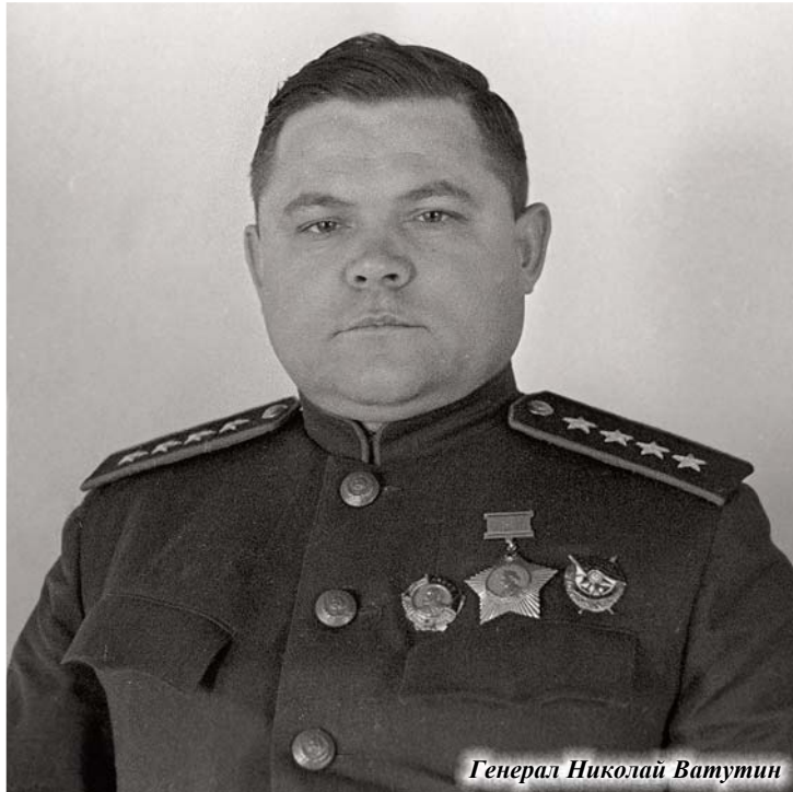
Генерал Николай Ватутин