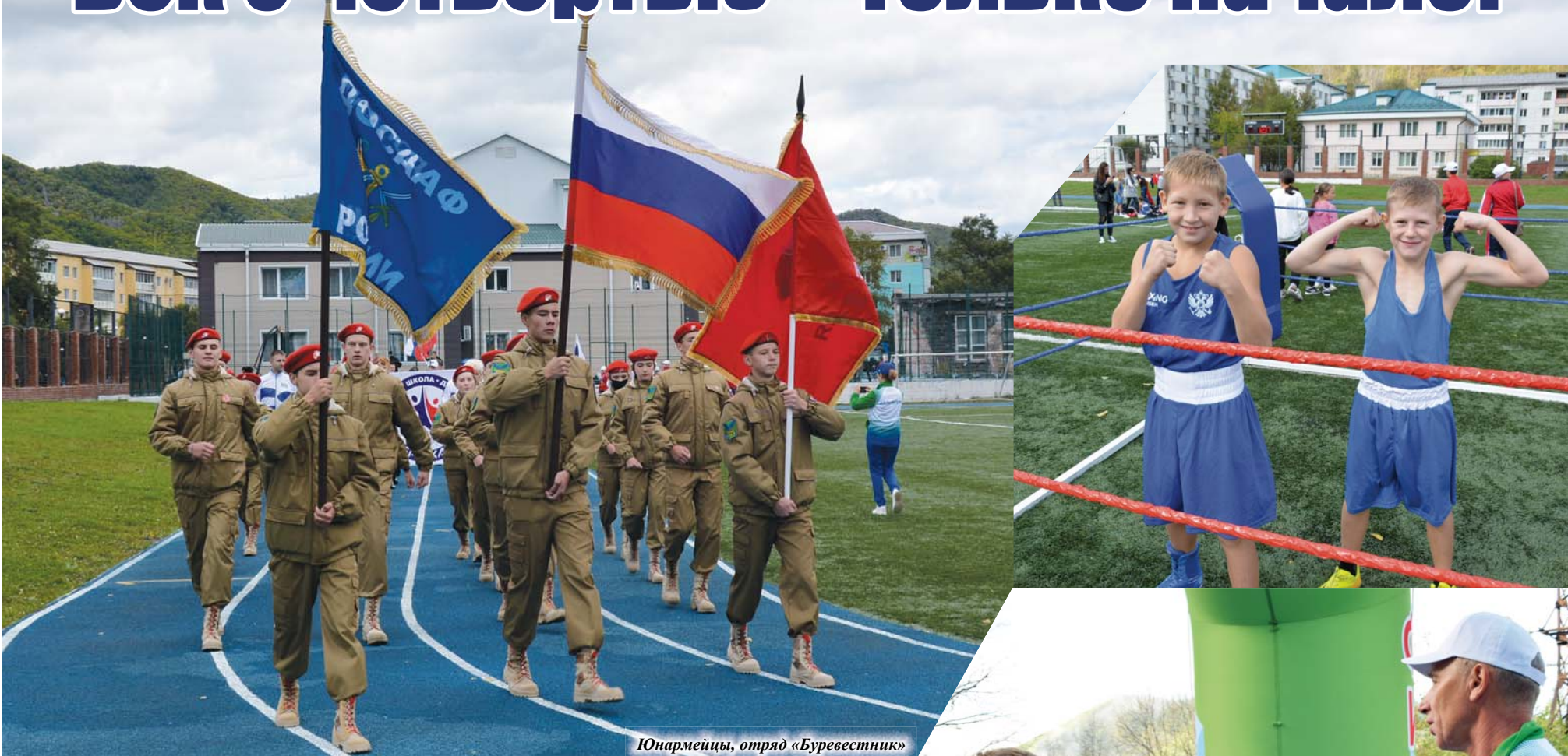
Юнармейцы, отряд «Буревестник»