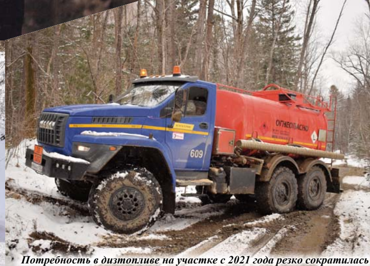
Потребность в дизтопливе на участке с 2021 года резко сократилась

Весна приходит на участок «Силинский» с опозданием. Отъехав от посёлка Хрустального, мы взбираемся по местами заледенелому серпантину. Ближе к вершине перевала под колёсами уже хрустит снег. Пересекаем новую ЛЭП, построенную в прошлом году энергетиками «Дальполиметалла», и на спуске встречаем местных обитателей – группу косуль. Почуввав наше приближение, парнокопытные стремительно удаляются, маскируясь в пестроте деревьев и сугробов.