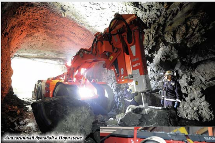
Аналогичный буровой в Норильске