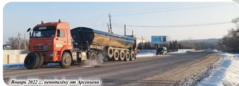
Январь 2022 г., неподалёку от Арсеньева

Дальнобойщик - всегда одиночка. Он должен не только хорошо водить, но и знать техническую часть на «отлично», чувствовать машину и при необходимости уметь «вылечить» её прямо на трас-