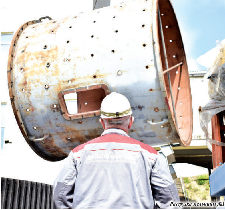
Разгрузка мельницы №1

За минувшие полгода на ЦОФ переработали без малого 500 тысяч тонн руды. Для того чтобы сохранить и преумножить возможности фабрики, ведутся целенаправленные работы. С начала июля проводятся сразу несколько важных мероприятий.