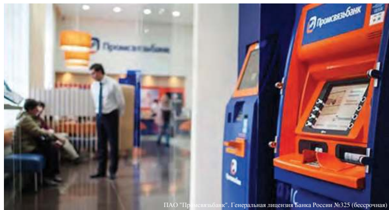
ПАО «Промсвязьбанк». Генеральная лицензия Банка России №325 (бессрочная)

Короче говоря, «длинный рубль» сильно «укорачивается». Вот и возвращаются наши флотаторы обратно в Дальнегорск, переболев «золотой лихорадкой». А «выздоровев», понимают, что от добра добра не ищут, что достойную зарплату они и дома получают, в «Дальполиметалле». Так что не подхватите заразу, не прощайтесь!