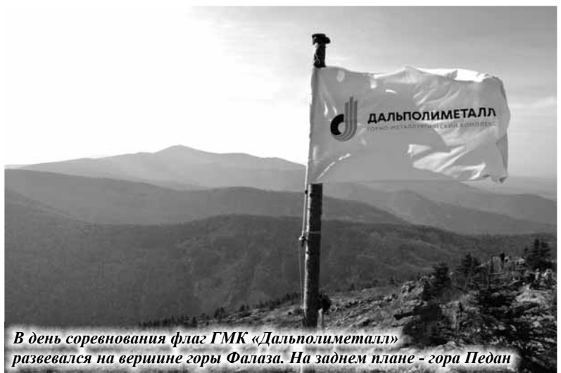
В день соревнования флаг ГКМ «Дальполиметалл» развевался на вершине горы Фалаза. На заднем плане – гора Педан

Дальнегорские спортсмены-юниоры продолжают удивлять своими результатами ведущих тренеров Приморского края – в октябре на седьмой по счёту мультигонке «Falaza Challenge» учащиеся школы №21 и школы №2 заняли призовые места и лишь немного уступили абсолютным чемпионам соревнования.