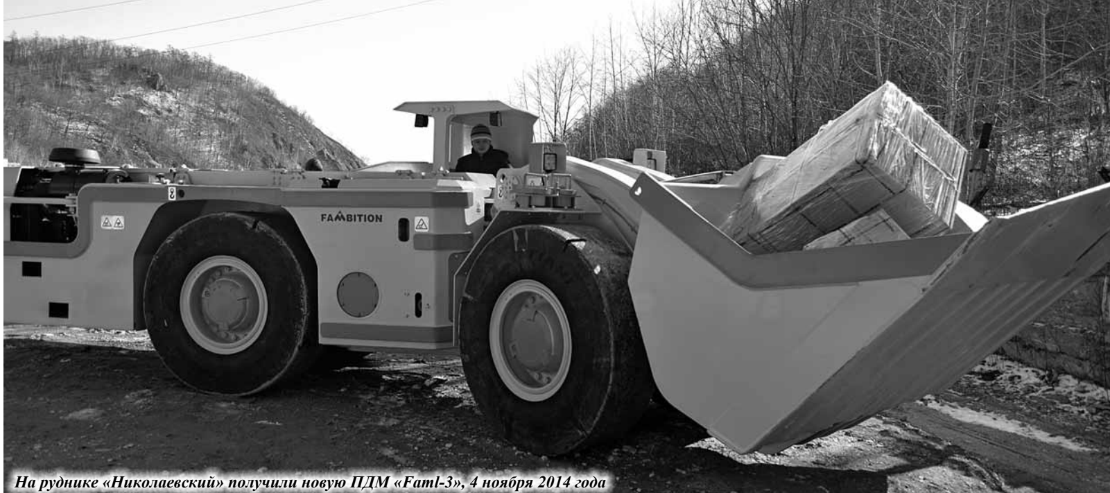
На руднике «Николаевский» получили новую ПДМ «Fam1-3», 4 ноября 2014 года

В День народного единства в ГМК «Дальполиметалл» случился двойной праздник – из порта Восточный на крупнейший рудник предприятия «Николаевский» привезли две погрузочно-доставочные машины «Fam1-2» и «Fam1-3», а на рудник «2-й Советский» – одну двухкубовую ковшевую машину той же компании «Fambition». Контракт на поставку подземной горной техники с китайской машиностроительной компанией «Fambition» ГМК «Дальполиметалл» заключает не в первый раз – например, ПДМ «Fam1-3» уже год эксплуатируется на «2-м Советском».